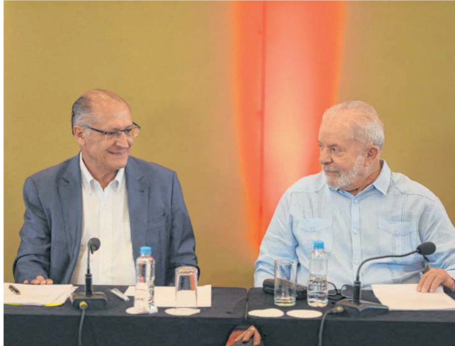
DOCUMENTO será apresentado a partidos aliados de Lula e Alckmin

A coordenação de campanha do ex-presidente Luiz Inácio Lula da Silva (PT) registrou em um documento as propostas de revogação da reforma trabalhista e do teto de gastos - regra fiscal que limita o aumento das despesas públicas à inflação. Partidos aliados receberam a prévia de 90 diretrizes para a montagem do programa de governo.