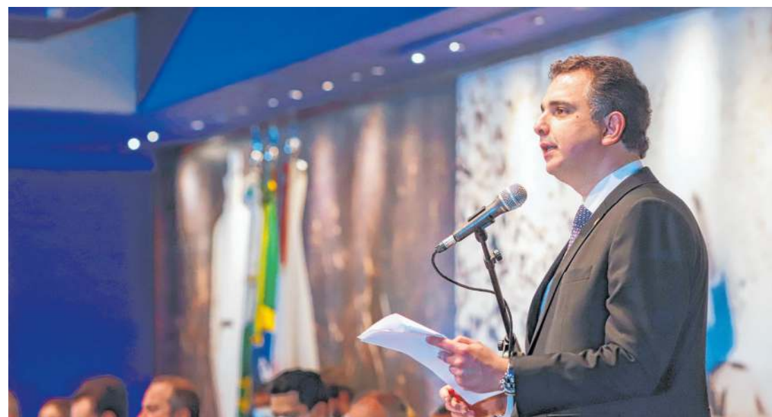
PRESIDENTE do Senado oficializou ontem a mudança para o PSD

Em clima de lançamento de candidatura ao Palácio do Planalto, o presidente do Senado, Rodrigo Pacheco (MG), assinou nesta quarta, 27, sua ficha de filiação do PSD. Pacheco afirmou que a definição de um projeto de candidatura somente será feito em 2022, mas já fez um discurso em tom de campanha, defendendo a união nacional e o fim da intolerância para que o País possa retomar seu desenvolvimento.